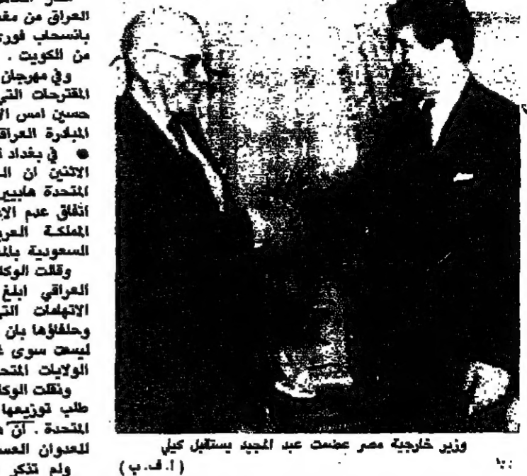
وزير خارجية مصر عصمت عبد المجيد يستقبل كيلي